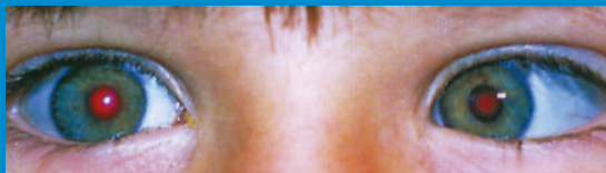
2. ZEZOWANIE JEDNEGO OKA DO WEWNĄTRZ LUB NA ZEWNĄTRZ